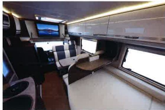
対面対座のセカンド&サードシートでおくつろぎいただくのはもちろん、リヤベッドのテーブルで食事をとりながらリヤベッドから大型テレビを観ていただくことも可能です。