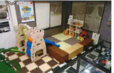
大型キッズコーナーを完備していますので小さなお子様がいっしょにご来店でもゆっくりとお楽しみいただける1台を確保していただけます。

SHOP INFO キャンピングカー 車中泊専門店 株式会社ダイレクトカーズ CAMPER LOCAL BASE MIE 〒510-0304 三重県津市河芸町上野 876-1 TEL: 059-253-4444 FAX: 059-253-8787 営業時間: AM10:00 ~ PM7:00 定休日: 火曜日、第1・3水曜日（祝祭日は除く）