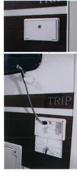
ホースを伸ばしてお使いいただける外部シャワーを備えています。