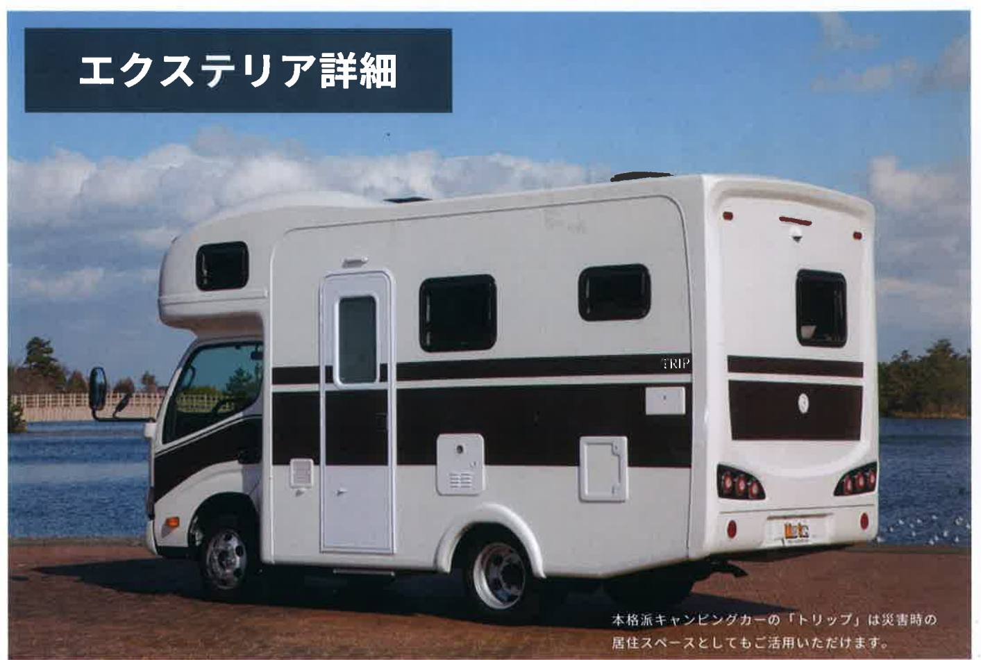
本格派キャンピングカーの「トリップ」は災害時の居住スペースとしてもご利用いただけます。