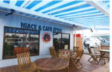
カフェテリアも用意しております。おひとり様で、カップルで、ファミリーで、ペット同伴でもお楽しみいただけます。

SHOP INFO キャンピングカー 車中泊専門店 株式会社ダイレクトカーズ CAMPER LOCAL BASE MIE 〒510-0304 三重県津市河芸町上野 876-1 TEL: 059-253-4444 FAX: 059-253-8787 営業時間: AM10:00 ~ PM7:00 定休日: 火曜日、第1・3水曜日（祝祭日は除く）