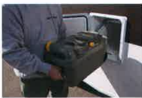
給水タンクに水を補充しやすいよう、リアハッチに水道ホースをそのまま入れられる給水口を備えております。