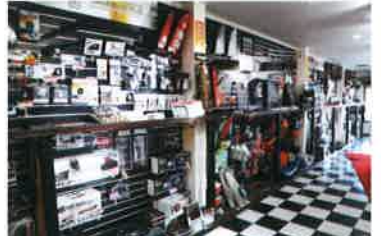
大型シェールーム内にハイエース専用パーツブランド「BLUME」をはじめ、有名ブランドのパーツを500以上取揃えています。

車中泊から本格キャンピングカーの楽園 企画・開発・販売 CAMPER LOCAL BASE MIE 東海地区最大級のキャンピングカー専門店です。新車館、中古車館、パーツ館、カフェテリアのほか、キャンピングカーの各種装備を製作したりカスタマイズを行ったりする自社工場も併設。世界に1台だけのこだわりのキャンピングカーをお作りすることも可能です。