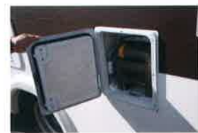
トイレの汚物を簡単に処理できるタンクも標準装備。