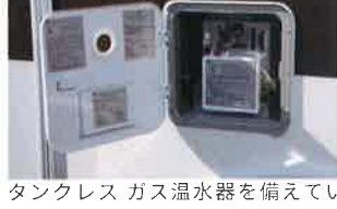
タンクレス ガス温水器を備えているため、温水シャワーを使用する際も室内温度への影響がありません。